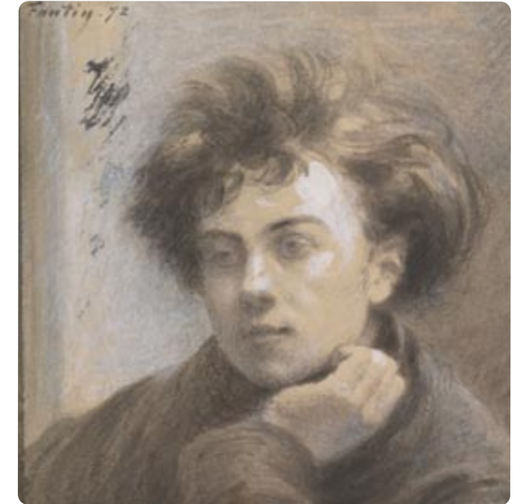
• Si la photo par Carjat date de fin décembre 1871, et la prise de modèle de Fantin Latour de février 1872, on pourrait observer ici la pousse des cheveux de Rimbaud en 1 mois 1/2 ou 2 mois